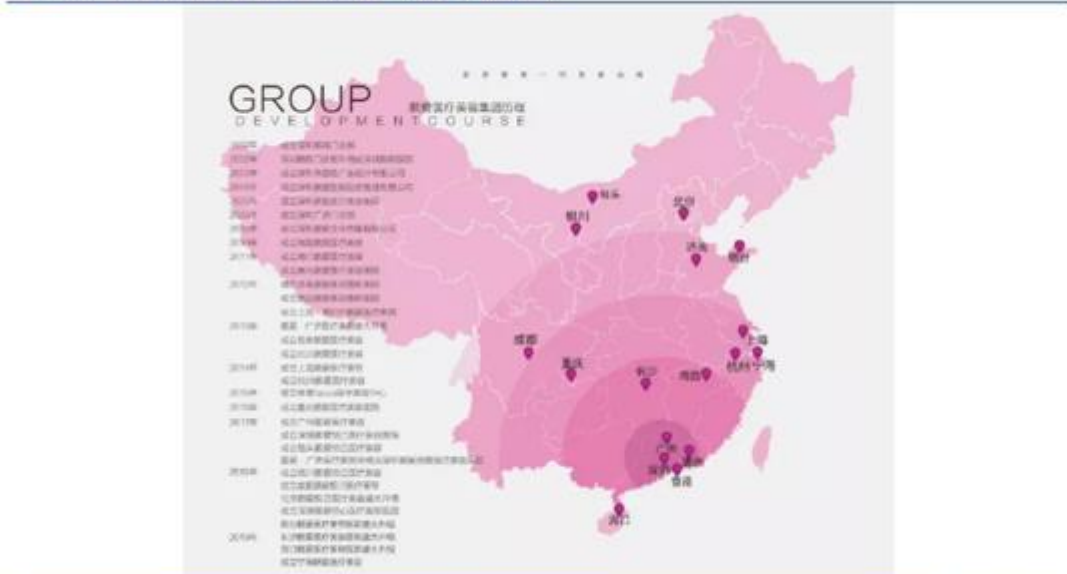
图 21：医美国际旗下鹏爱医院全国布局

新建医美机构往往需要经过一定时间段的爬坡期才能达到盈亏平衡，因此医美国际旗下扩张多以收购整合方式推进。从地区选择而言，鹏爱医院于深圳创立，公司在当地具有较多资源，因此在收购标的的选取上更为偏向华东、华南地区的医院。近期公司加快小型卫星诊所在华南、华东等三四线城市的落地，瞄准社区医美细分赛道，以轻医美为主打，更快对接当地的轻医美需求，贴合消费者家门口完成轻医美诉求。