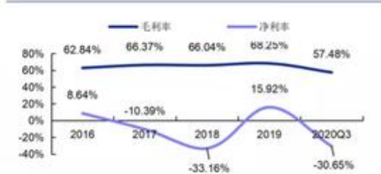
图 20：医美国际 2016-2020Q3 毛利率及净利率